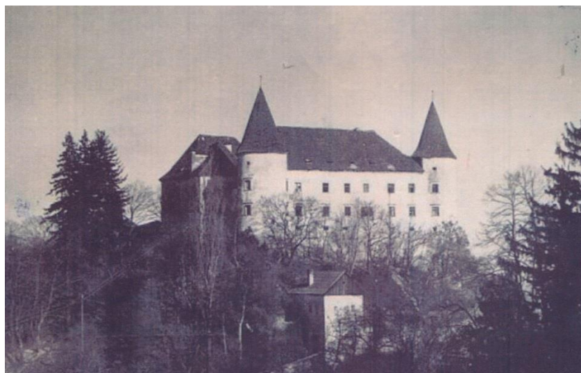
Bizeljski grad (razglednica je vzeta iz interneta).