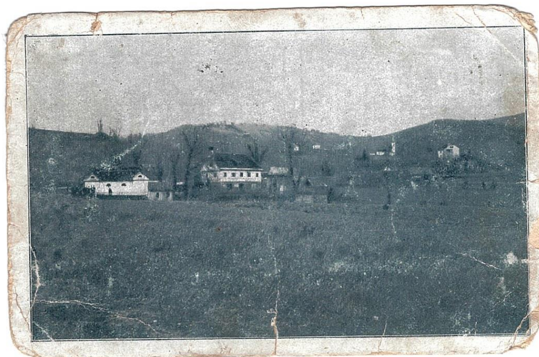
Toplice Bušeča vas