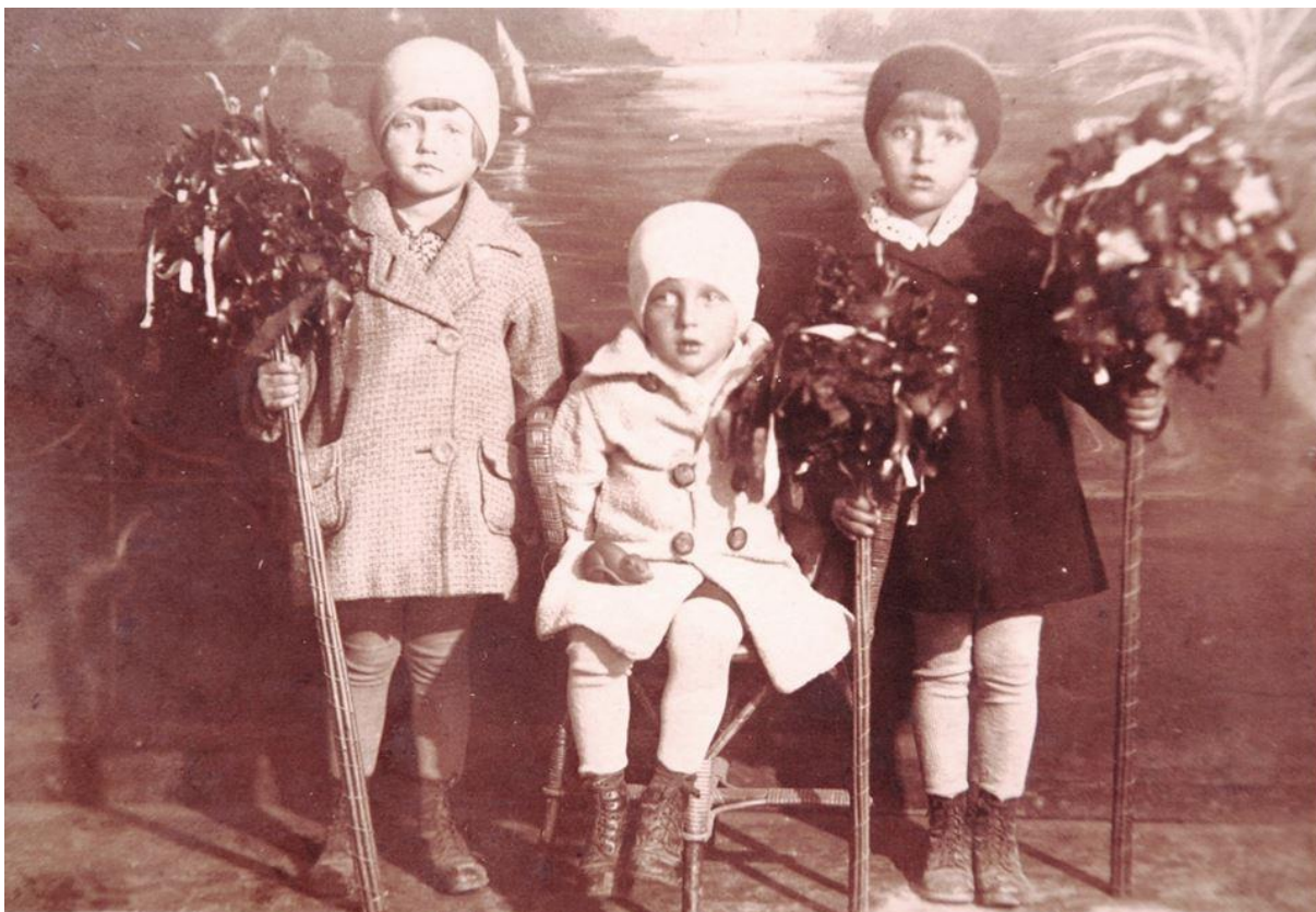
Otroci z velikonočnimi butaricami po 1. svetovni vojni v ateljeju fotografa Vinka Bavca v Brestanici.