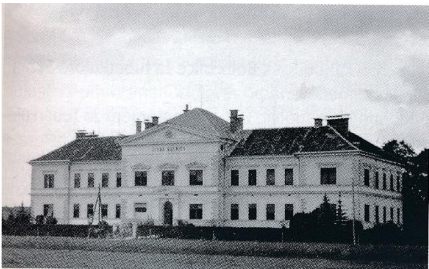
Splošna bolnišnica Brežice leta 1889.