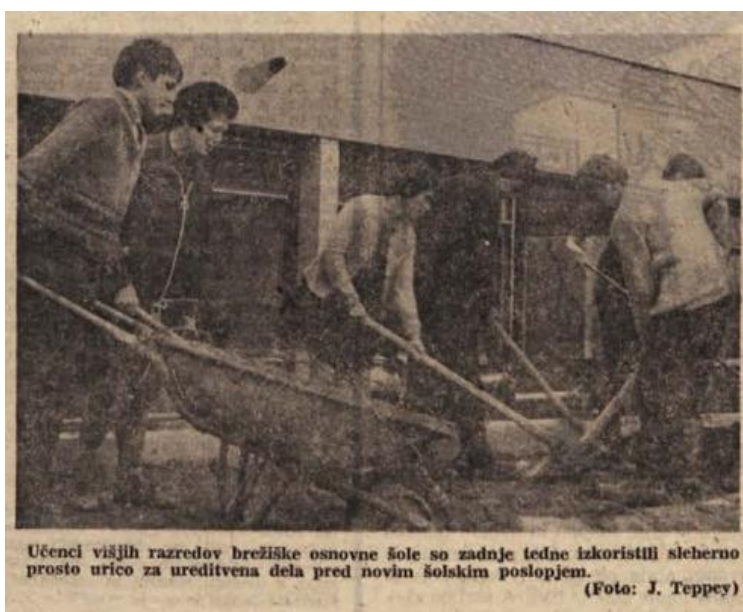
Učenci višjih razredov brežiške osnovne šole so zadnje tedne izkoristili sleherno prosto urico za ureditvena dela pred novim šolskim poslopjem.