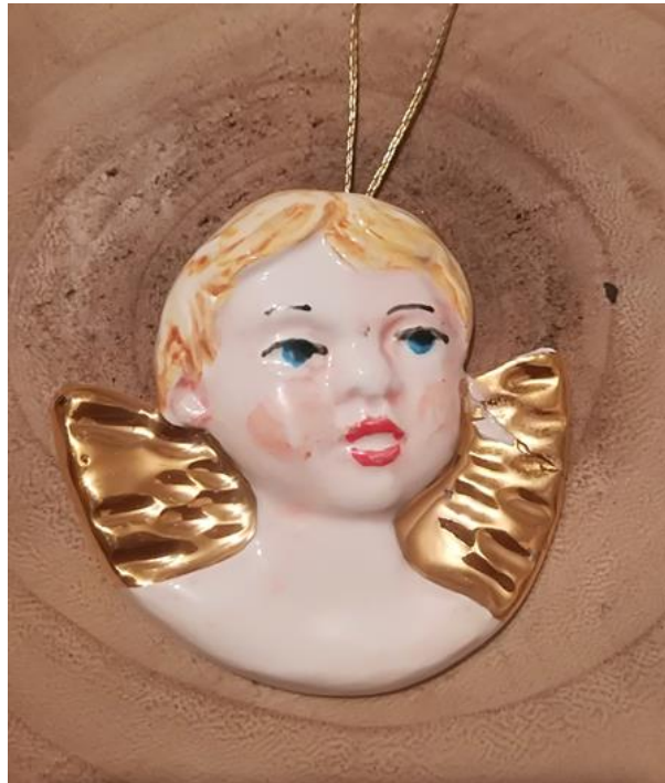
Ročno poslikan angelček je delo Cvetke Miloš.