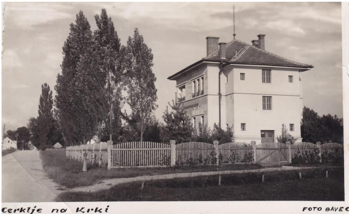
Razglednica Cerklje ob Krki, stavba nekdanjega zdravstvenega doma okoli leta 1930.

Velika oddaljenost od večjih mest je bila vzrok, da je bilo prebivalstvo na območju Cerklj ob Krki zelo nevedno glede zdravstva in higieni. Živeli so po starih navadah in se ravnali po starih šegah in običajih, tako glede zdravljenja in nege bolnikov kot nege porodnic, otrok in dojenčkov. Slabo je bilo tudi zdravstveno stanje prebivalstva. Nenehno so se ponavljale nalezljive bolezni, kot so škrlatinka, tifus, griža in davica. Močno je razsajala tudi tuberkuloza, še posebej po prvi svetovni vojni.