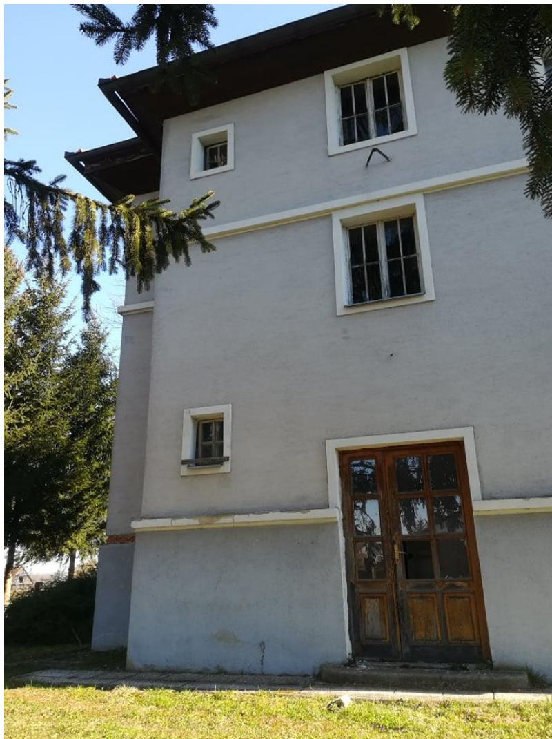
Podoba nekdanjega zdravstvenega doma danes (2021).

V stavbi so bila kasneje še stanovanja. Današnjega obiskovalca pa pričaka takšna podoba nekdanjega cerkljanskega zdravstvenega doma.