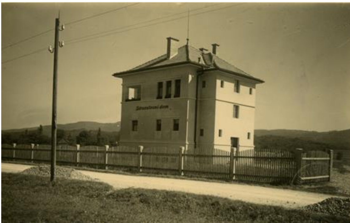
Stavba Zdravstvenega doma v Cerkljah ob Krki leta 1930.

V zdravstvenem domu je delovalo tudi ljudsko kopališče. Za odrasle je bilo odprto vsako soboto popoldne, za šolske in predšolske otroke po potrebi in v dogovoru z vodstvom šole. Za otroke je kopališče poslovalo brezplačno, odrasli so plačevali posebno pristojbino. V prvih treh letih je bila uporaba kopališča za vse, ki so z denarnimi sredstvi ali z delom prispevali k zgraditvi zdravstvenega doma, brezplačna. Posledično je bila uporaba kopališča v tem času zelo velika.