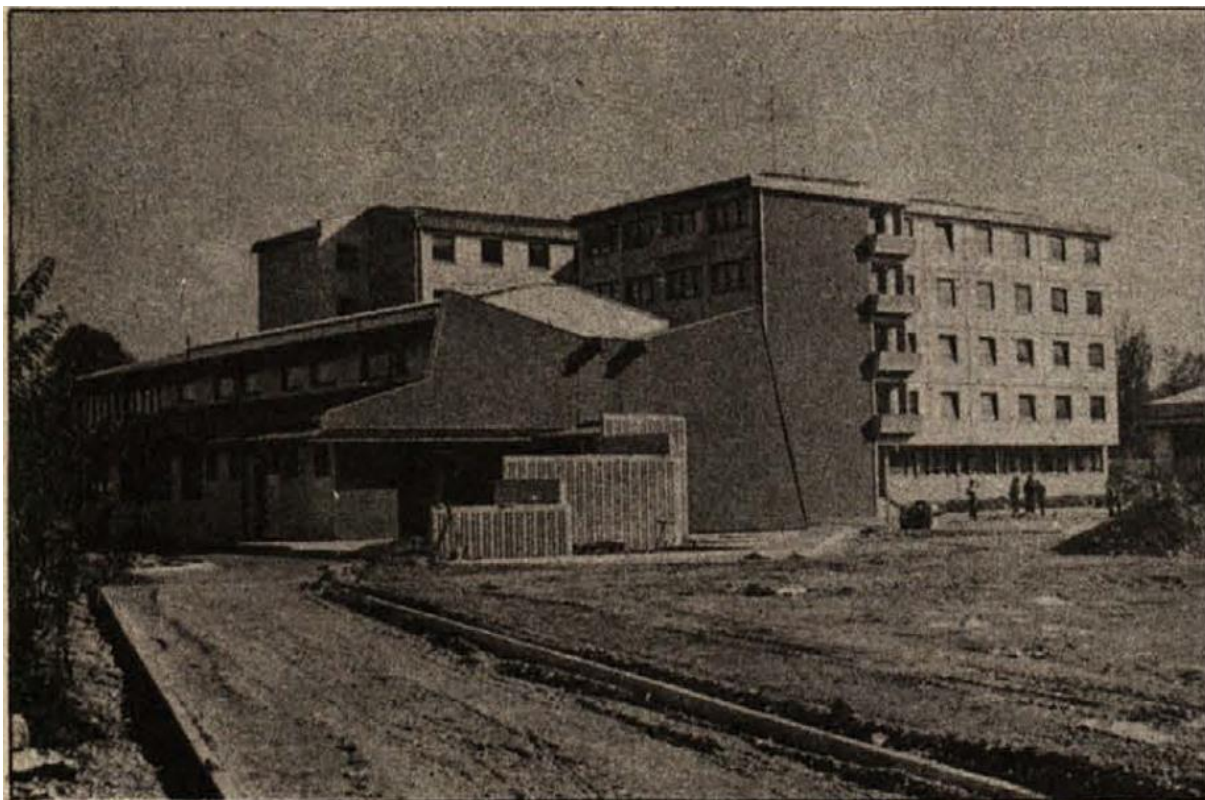
Novi dijaški dom z matično knjižnico