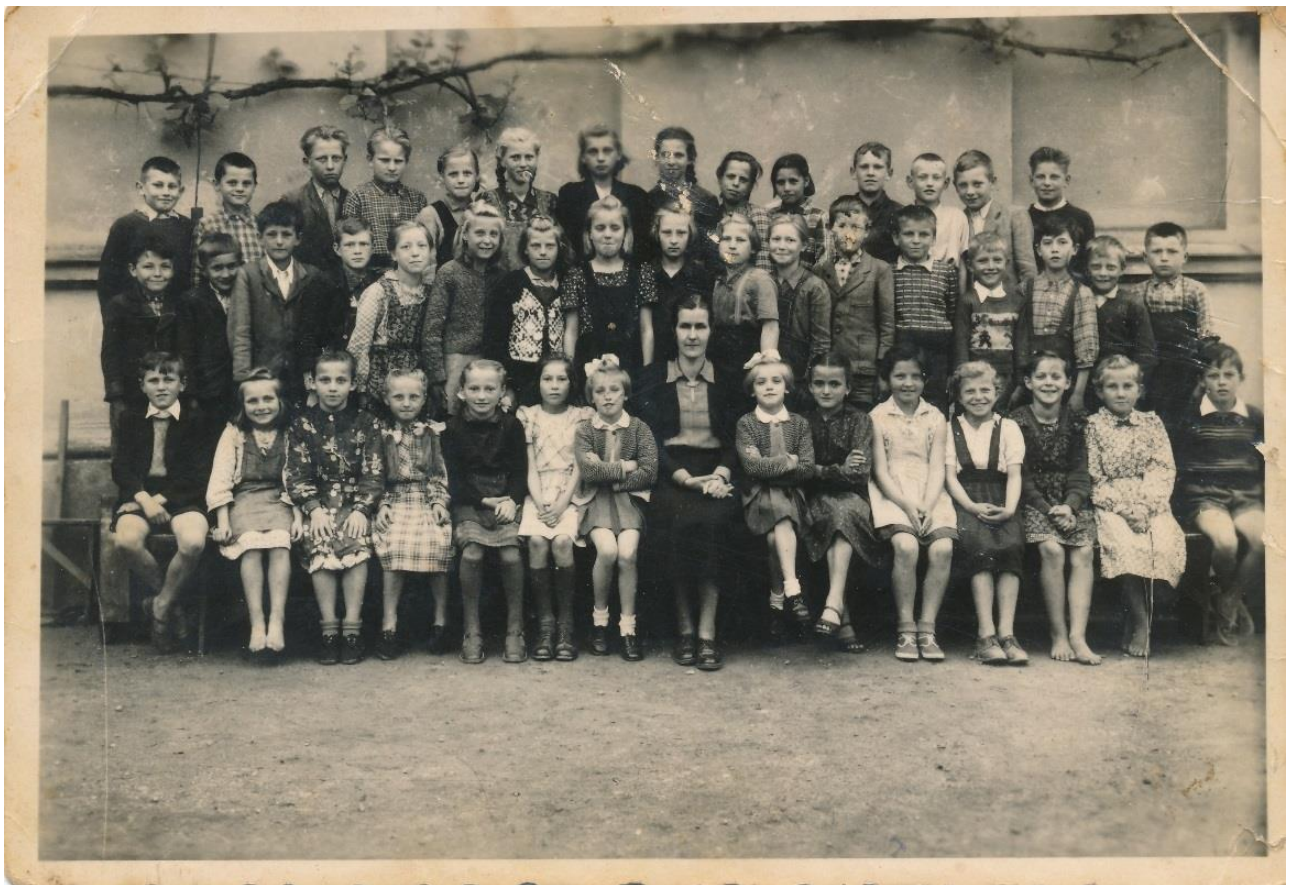
Osnovno šolo je obiskoval v Ljutomeru. Na fotografiji s sošolkami in sošolci v 3. razredu.